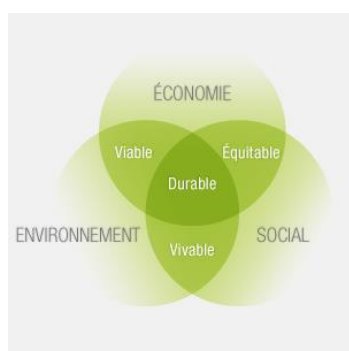
Les piliers du développement durable